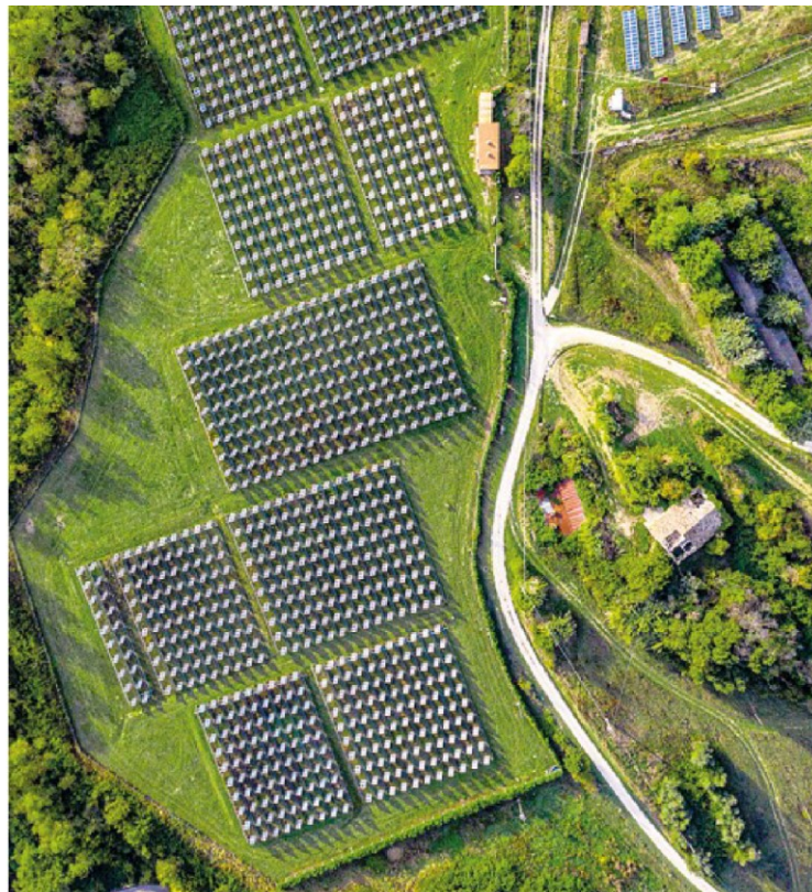
Lavoro e ambiente. L'economia green nel rapporto di Fondazione Symbola