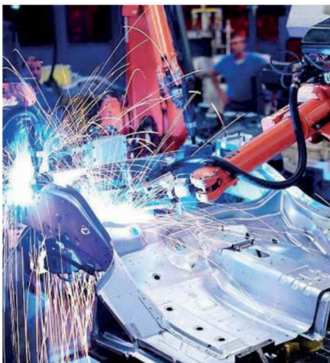
Il rapporto Mediobanca. Nel Bresciano 216 medie imprese industriali