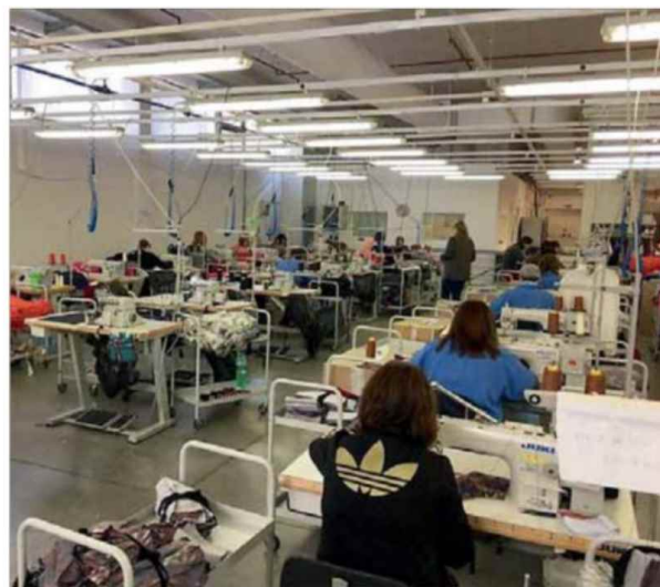
L'interno di uno stabilimento di una azienda tessile

Il direttore dell'Area Studi di Mediobanca Gabriele Barbaresco evidenzia i «risultati molto positivi» registrati finora, sottolineando però l'esistenza di «ampi spazi di miglioramento». «Dall'indagine di quest'anno - spiega - emerge che solo due imprese su 10 ritengono di avere strumenti adeguati per affrontare l'incertezza». Per questo Barbaresco indica come soluzione da adottare il «Future Readiness Committee», ideato nei paesi anglosassoni per «supportare il top management nell'analisi degli scenari più complessi e nella definizione delle iniziative necessarie». Il punto, secondo il presidente del Centro Studi Tagliacarne Giuseppe Molinari, sta nel guardare avanti: la competitività delle medie imprese italiane «passerà dalla capacità di coniugare la continuità del modello imprenditoriale con una trasformazione più profonda».