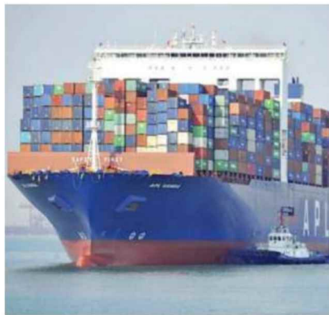
Una nave carica di container

ni sia dell'occupazione complessiva. Nell'arco dei ventinove anni osservati, il segmento è cresciuto per numero di imprese (da 3.377 a 3.491), giro d'affari complessivo (+178,3%), vendite oltreconfine (+290,7%) e occupazione (+47,2%). In Toscana, il 9% circa delle medie imprese è concentrato nell'area di Siena, dove realizza ricavi pari a 1,1 miliardi di euro, corrispondenti al 10% del totale realizzato dalle aziende regionali di taglia intermedia. "Le medie imprese industriali italiane restano uno dei pilastri più solidi del nostro sistema produttivo, per capacità competitiva, presenza nelle filiere e apertura ai mercati esteri" ha detto Andrea Prete , Presidente di Unioncamere . "Proprio per questo, l'aumento dell'incertezza internazionale e la volatilità dei costi energetici e delle materie prime non vanno sottovalutati: possono ridurre il potenziale di crescita di queste imprese. Occorre accompagnare questi campioni del made in Italy con politiche industriali, strumenti finanziari e servizi territoriali capaci di rafforzare resilienza e investimenti". ●