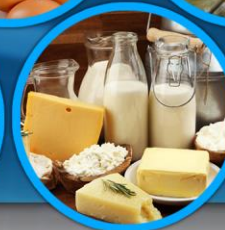
Tabella 1: Indice dei prezzi ufficiali all'ingrosso di Riso e Cereali, Carni, Latte, Formaggi e uova, Oli e grassi