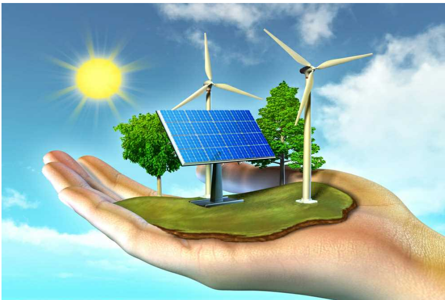
Energie rinnovabili

Publicato 17 ore fa il 17 Luglio 2024 Da Andrea Aletto