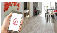
Airbnb nel mirino del