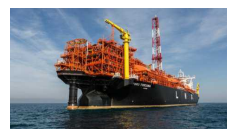
Gas liquefatto: stabile