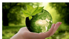
Intesa Sanpaolo e Bei: