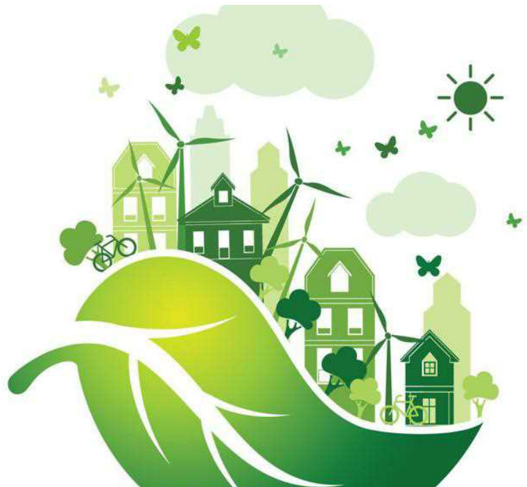
Sviluppo sostenibile - (Fotolia)

Nel quinquennio 2018-2022, sono state 510.830 le imprese che hanno effettuato eco-investimenti pari al 35,1% del totale ovvero più di 1 su 3. Sono i dati del Rapporto GreenItaly, arrivato alla quattordicesima edizione, realizzato dalla Fondazione Symbola e da Unioncamere , con la collaborazione del Centro Studi Taqliacarne e con il patrocinio del ministero dell'Ambiente e della Sicurezza Energetica. Al rapporto hanno collaborato Conai, Novamont, Ecopneus, European Climate Foundation, molte organizzazioni e oltre 40 esperti.