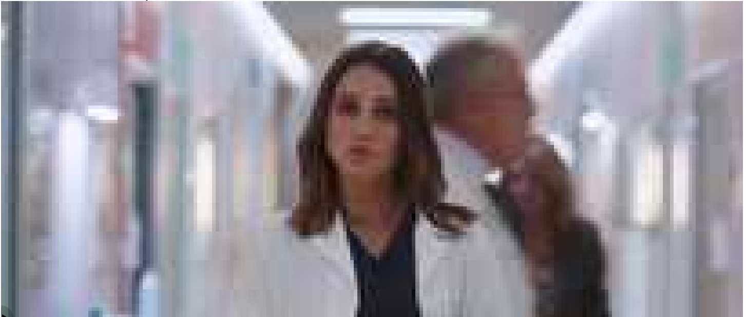
Gli artisti per i Centri Antiviolenza: 'Donate un sms'