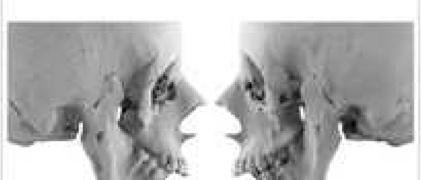
Nata con la bocca serrata, ora a 16 anni sorride