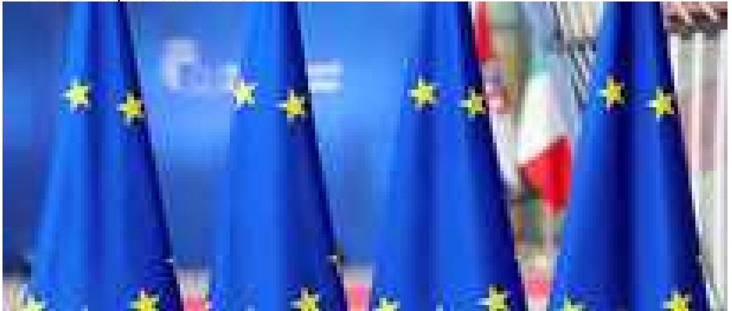
I Paesi Ue ratificano Il Chips Act, la produzione raddoplierà