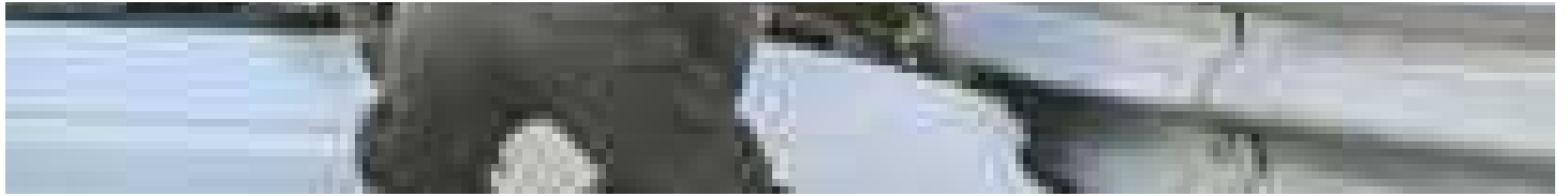
Sulle strade 3.159 morti nel 2022, nove al giorno