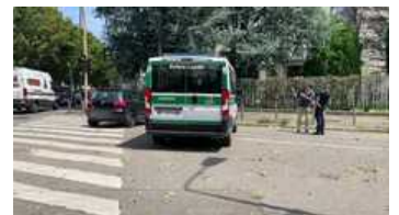
Nubifragio a Milano, crolla un muro al campo da calcio di via Golgi