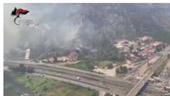
Incendio Palermo, i Carabinieri sorvolano la zona colpita