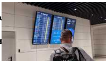
A Fiumicino i primi italiani rientrati da Rodi: "Tanta paura"