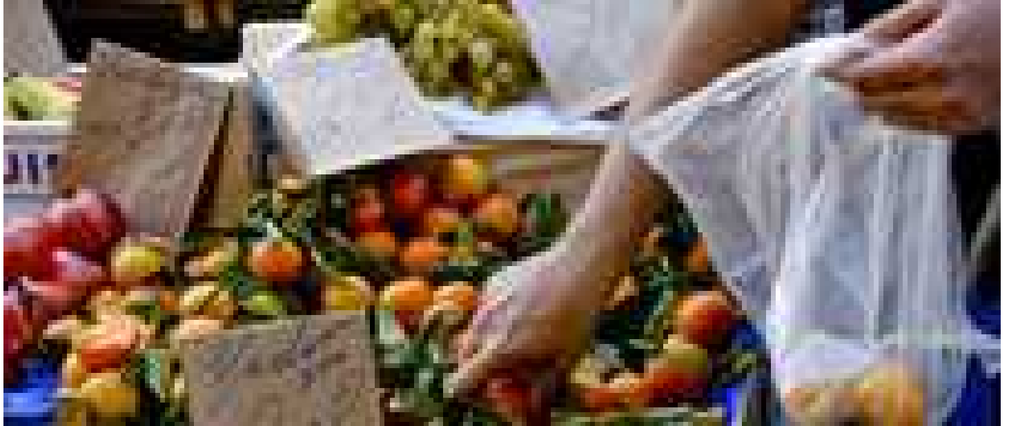
Volano i prezzi del cibo ma i contadini sottopagati del 21%