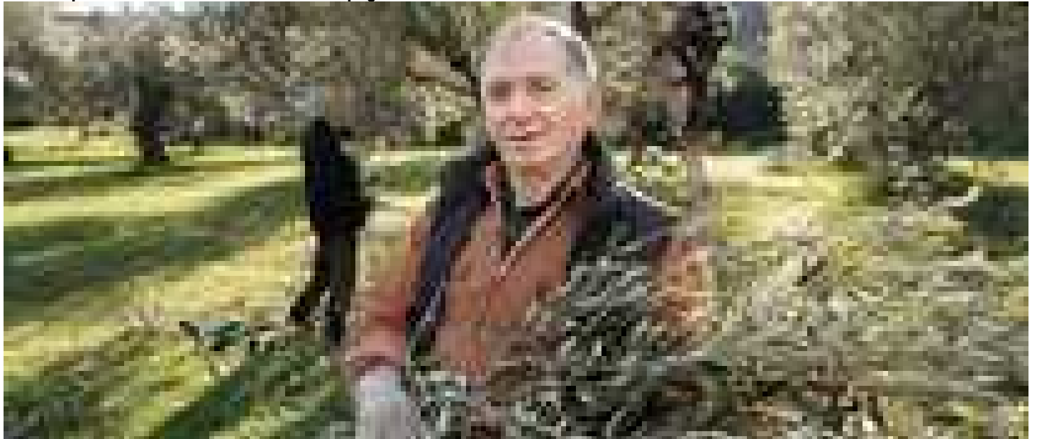
Un'altra economia è possibile