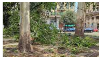
Nubifragio Milano: danneggiate linee tram e Giardini Indro Montanelli