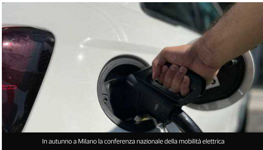
In autunno a Milano la conferenza nazionale della mobilità elettrica

La settima edizione di e_mob si svolgerà dal 7 al 10 ottobre 2023 tra Palazzo Giureconsulti e Piazza Duomo, con un format coinvolgente e un ricco programma di appuntamenti