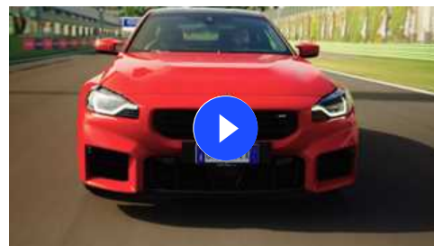
In pista a Vallelunga con la nuova Bmw M2