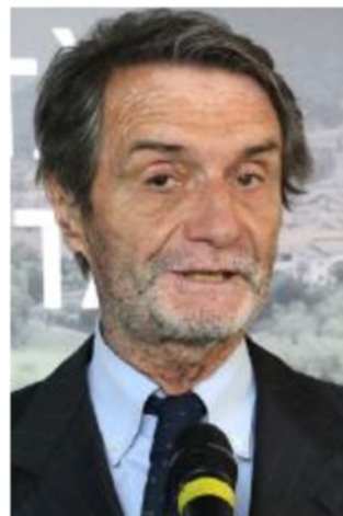
Il presidente Attilio Fontana