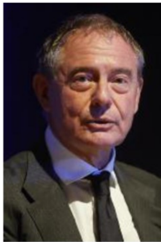
Il ministro Adolfo Urso