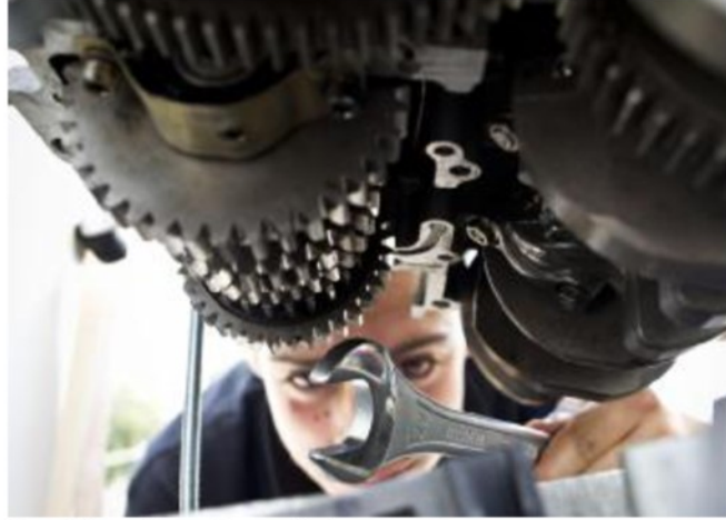
Un artigiano al lavoro in una officina meccanica

C'è poi il macro tema relativo a «Cultura e creatività», grazie all'indiscusso patrimonio storico artistico dell'Italia. Le imprese del settore culturale e creativo costituiscono una parte notevole dell'e-