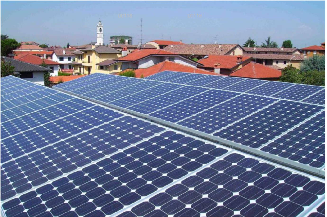
Il fotovoltaico è uno delle tecnologie di riferimento per la produzione di energia elettrica green

ARTICOLO NON CEDIBILE AD ALTRI AD USO ESCLUSIVO DEL CLIENTE CHE LO RICEVE - 118