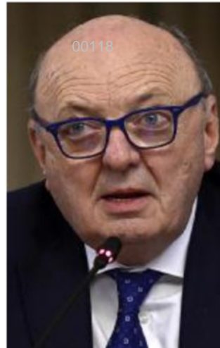
Il ministro Gilberto Pichetto Fratin