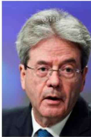
Paolo Gentiloni, commissario Ue