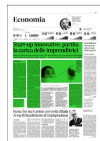
Superficie 42 %