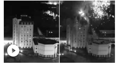
Ucraina, i russi bombardano gli uffici del municipio di Enerhodar (vicino alla centrale nucleare di Zaporizhzhia) Le immagini girate la notte tra mercoledì 19...