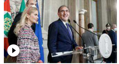
Consultazioni, La Russa: «È sempre emozionante stare con Mattarella» "L'incontro è stato cordiale" - Agenzia VIST...