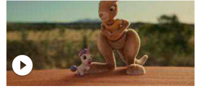
"Come and Say G'day": l'Australia invita il mondo Down Under con un nuovo spot Tourism Australia ha realizzato un cortometr...