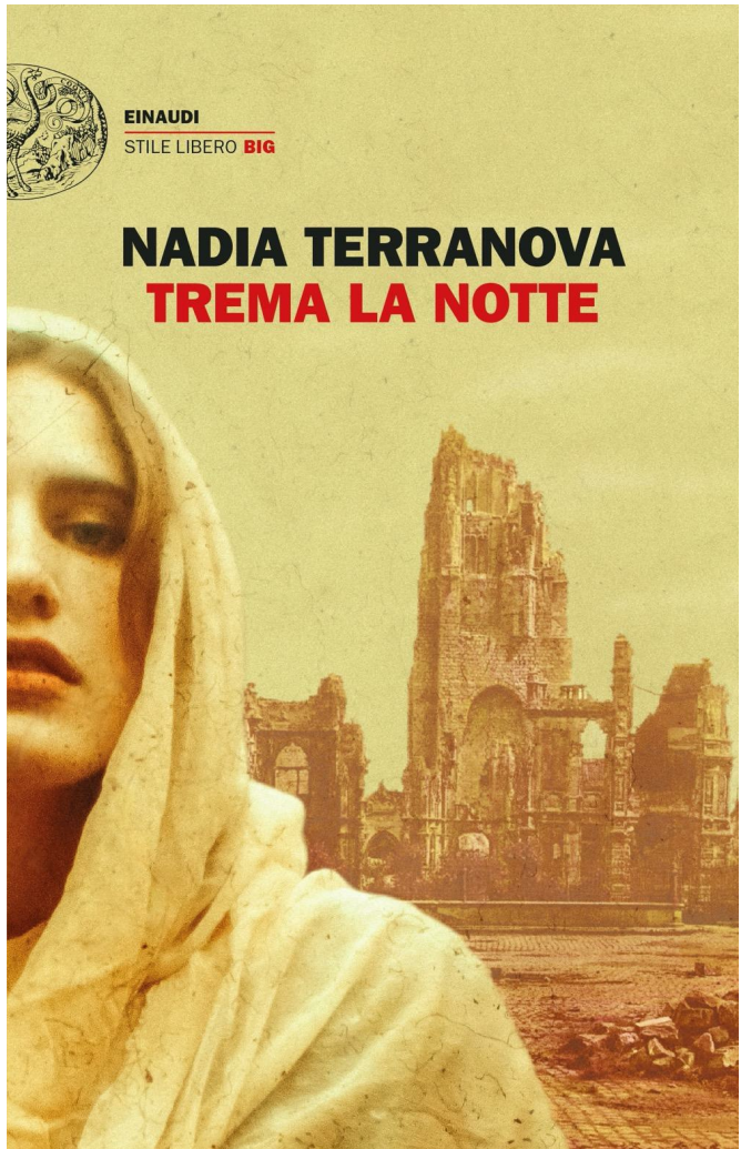
"Trema la notte", romanzo di Nadia Terranova, autrice già finalista al Premio Strega nel 2019, è la storia di due vite parallele, che ha inizio alla vigilia del terribile terremoto del 1908