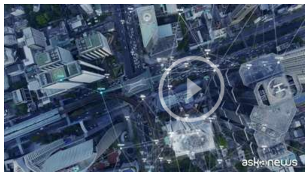
Big Data, opportunità di crescita per le PMI