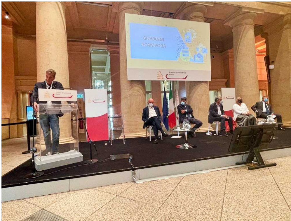
Un momento della conferenza stampa "Sicurezza e Innovazione Digitale delle Imprese"

«Le tecnologie hanno e avranno sempre di più un ruolo fondamentale nel nostro nuovo modo di vivere il mondo e il sistema produttivo - ha proseguito Acampora - Le emergenze, da quella sanitaria a quella ambientale, oltre a quelle economiche e sociali, spingono verso soluzioni ad alta tecnologia e nuovi modelli di business. Occorre quindi realizzare un cambiamento pervasivo di molti dei paradigmi fondanti la nostra società e che riguardano: lavoro, istruzione e impresa, che saranno ridisegnati anche in un'ottica di piena sostenibilità ambientale. In tale chiave innovativa, la Digitalizzazione è un tema cruciale. Dobbiamo essere in grado di ridisegnare un mondo migliore e un futuro sostenibile, creando anche nelle micro realtà provinciali un clima culturale favorevole all'innovazione ed un ecosistema incline al digitale - ha aggiunto il presidente Acampora - Camere di Commercio e mondo delle imprese stanno percorrendo insieme questo cambiamento epocale che sta portando a nuovi modi di interagire, nella consapevolezza che il progresso tecnologico, in tutte le sue espressioni, può cambiare faccia all'azienda: reagire agilmente all'innovazione significa essere disposti a ripensare il proprio modello di business prima che lo faccia qualcun altro in qualche altra parte del mondo».